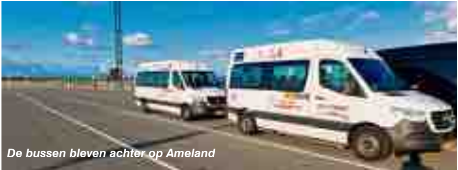
De bussen bleven achter op Ameland