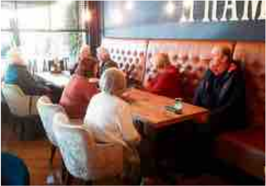
Wachten op de koffie in Oosterwolde