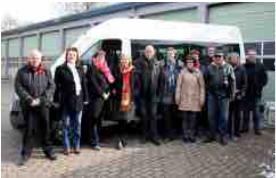
De eerste vrijwilligers van de plusbus op 11 maart 2013.